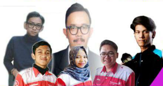
ALUMNI YANG SUDAH BEKERJA